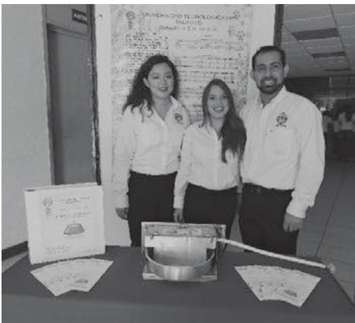
Expo Proyectos septiembre-diciembre 2016

http://www.uttab.edu.mx/viewActividadUniversitariaPDF.action?id=572