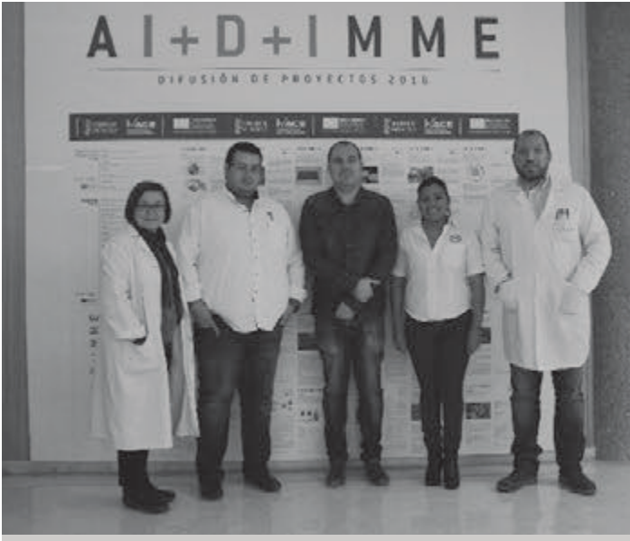
Personal de la UTTAB y de AIDIMME, en Valencia, España

El Instituto Tecnológico, Metalmecánico, Mueble, Madera, Embalaje y Afines (AIDIMME) con sede en Valencia, España, capacitó a personal del Centro de Calibración y Pruebas (CECAP), del 21 al 25 de noviembre, para que la UTTAB brinde servicios de auditoría al sector forestal, en especial, a los fabricantes de madera que deseen exportar sus productos a Estados Unidos de América (EUA).