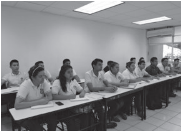
Alumnos de 1 "B" de Gastronomía