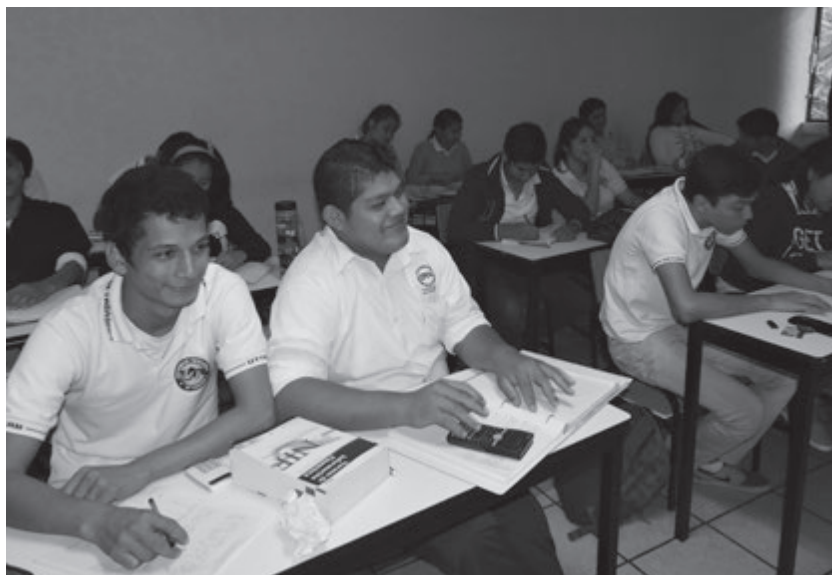
Alumnos de 2 "A" de Contaduría