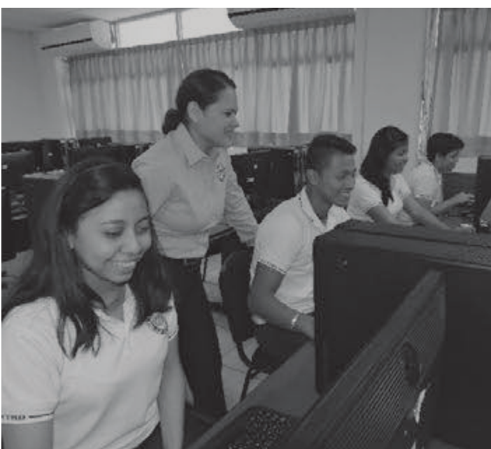
Ha sido reconocida con el Mérito Académico por su desempeño docente

Finalmente, comparte con la comunidad universitaria un mensaje “estudiantes luchen por sus sueños y metas, sean constantes, responsables y comprometidos, vivan con honestidad y valores. Al final obtendrán los frutos de lo que hayan sembrado”.