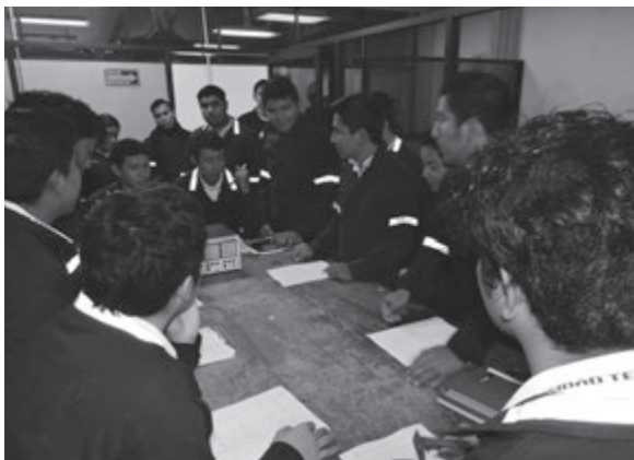
Alumnos de 2 "B" de Mantenimiento área Industrial