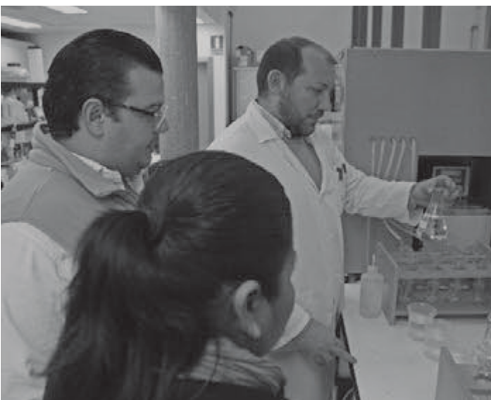
Llevaron a cabo análisis de los procedimientos y documentación en las auditorías como cuestionarios y toma de muestras

http://www.uttab.edu.mx/viewActividadUniversitariaPDF.action?id=570