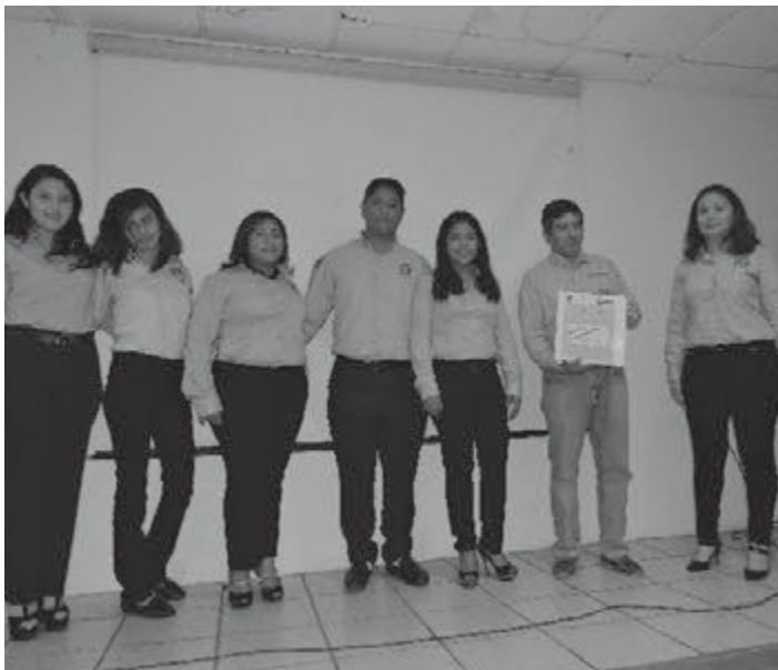
Estudiantes entregaron Planes Estratégicos a empresarios

La 4ta. Semana de Administración y Gestión de Proyectos (AGEP) fue organizada por 167 estudiantes de los programas educativos de Técnico Superior Universitario (TSU) en Administración área Administración y Evaluación de Proyectos, TSU en Desarrollo de Negocios área Mercadotecnia y TSU en Contaduría, quienes fueron asesorados por sus profesores, del 6 al 8 de diciembre.