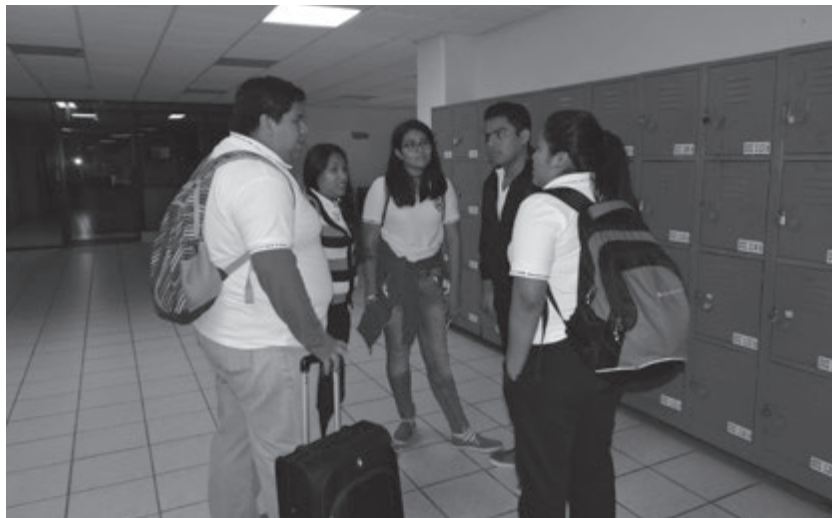
Alumnos de 5 "B" de Gastronomía