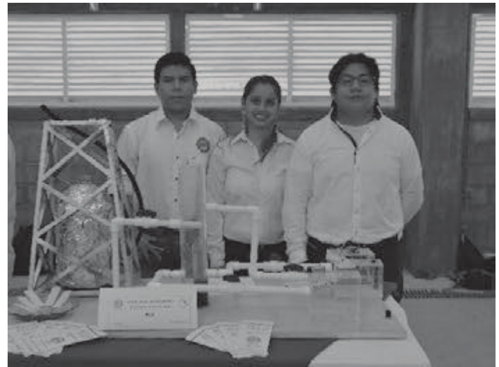
Proyecto: Procesos Especializados en Educación área Petróleo

Las nuevas generaciones que se forman en esta Casa de Estudios durante su preparación profesional se enfocan en desarrollar productos y ofrecer servicios en los que incorporan tecnología limpia. Para mostrar sus competencias adquiridas en el cuatrimestre septiembre-diciembre 2016, los alumnos de la División Académica de Procesos Industriales llevaron a cabo la Expo Proyectos Otoño 2016, el 2 de diciembre.